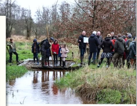
ts kwamen zondag in De Vennen alles te weten over valleiherstel en het belang van provincie Antwerpen

KEMPERN – Begijn vertelt het verhaal van “Koning in de Kampen”. Het verhaal van de Koning van de Kempen is dat hij in 1450 het land groeide die nu de Kempen heet. Reeds het boek van 20 maart is nu te koop. Meer info: www.kempen.be HERENTALS – Er wordt een openbaar onderzoek gepubliceerd voor een mogelijke aanleg van kanaal 2, voor het gebied van de wateren van Springstufus. De aanleg heeft betrekking op de parkeer- www.belgaonline.be