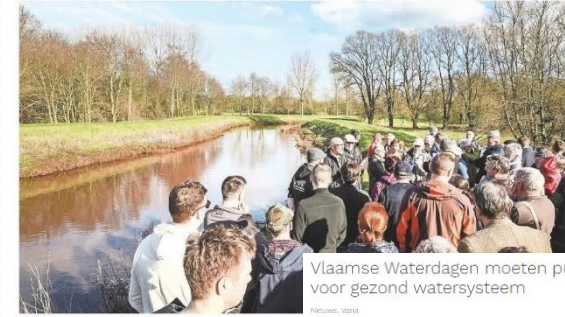
Vlaamse Waterdagen moeten publiek warm maken voor gezond watersysteem