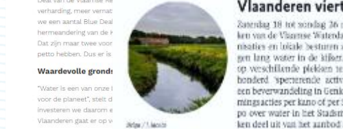
Waardevolle grond: “Water is een van onze i voor de planeet”, stelt d investeren we daarom e Vlaanderen gaat er op v

De Vlaamse Waterdagen zijn al aan hun derde editie toe en worden georganiseerd door de Vlaamse Milieumatschappij. Op het programma staan zowel ontspannende wandel- en fietsstochten, leerzame wateractiviteiten als opruimingsacties. Zo vaart Aquafin op 22 maart uit met De Milieuboot, een boot die in het kader staat van wateractiviteiten. Daarnaast worden er ook diverse opruimings- en overstromingsacties gepland. “De Vlaamse Waterdage watersysteem in Vlaand Deal van de Vlaamse Re verhandig, meer vernat we een aantal Blue Deal hermeandering van de ? Dat zijn maar twee voor- petto hebben. Dus is er