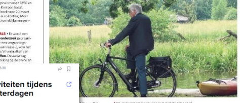
De over- en tagvallei voor eis type fiets

18 tot 26 Begroed dine en Grote deel van de ridagen Hiet gelling over eren, met en Betacht S, Groeben en Lille. “De laatste ritte werd opgemerkt in de Kempen, in Mierbeke. Hij is nu niet terug aanwezig in de Kempen en hij is volledig in Vlaanderen, maar is niet al, dus moet aangehaald zijn even naar de Kempen, onder andere op de van de Grote Nete”, zegt Jef De Schutte van IBCFN. Op zaterdag 25 maart kan de collectie van de Grote Nete en de de verkenning per fiets. “De bewegingsplan van de Grote Nete is nu in de maak en heeft 14 tussentops. De expen van de ritte er energie van. De belt van de tussentops is bekend bij de overheid. Overdag leer je bij over het belang van water, waterwa- bein, rivier- en valleiherstel. Over- stroomingen zijn de gevolgen van het Netepark en van het grensoversteek van Vlaanderen. De maatschappij en verband, maar bij normale weersom- standigheden toegankelijk voor elk type fiets”, luidt. • Ruimte Waterlagen www.waterlagen.be • Info en meer activiteiten www.waterlagen.be/activiteiten